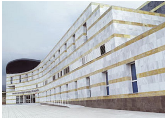
Sede del CTAP